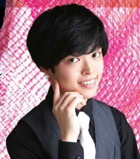
Solist & Conductor 塩崎基央 なで肩のモD Motochika Shiozaki

2022.7.15 金 開演19:00 開場18:30 かつしかシンフォニーヒルズモーツァルトホール